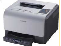
extrem klein extrem leise extrem gut Samsung CLP 300 Farblaserdrucker